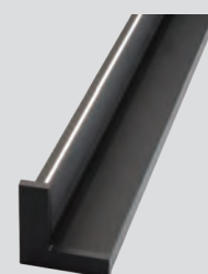
F32 _ Mattschwarz

SYSTEMA ist ein strukturelles Beleuchtungsprofil mit doppelter Lichtkammer und Nut für die Zubehörteile der Kollektion, das für die Wandanwendung unter Kücheneinheiten empfohlen wird. Es verfügt über eine LED-Lichtquelle mit entweder einer zweifachen einfarbigen (UHE6B 280 LED/m 10W/m), zweifarbigen D-Motion (SHE6B 168+168 LED/m 10W/m) oder zweifarbigen D-Motion Wave (HE6B 120+120 LED/m 14W/m) Konfiguration. Das Befestigungssystem mit versteckten Schrauben und Träger wird zur Installation auf Oberflächen aus Ziegeln, Gipskarton, Holz usw. verwendet. Das Netzteil ist nicht enthalten und muss separat bestellt werden (kann auch auf NETY - siehe Zubehör - integriert werden).